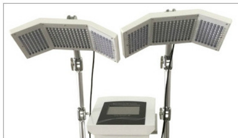
7 colors double panels PDT LED